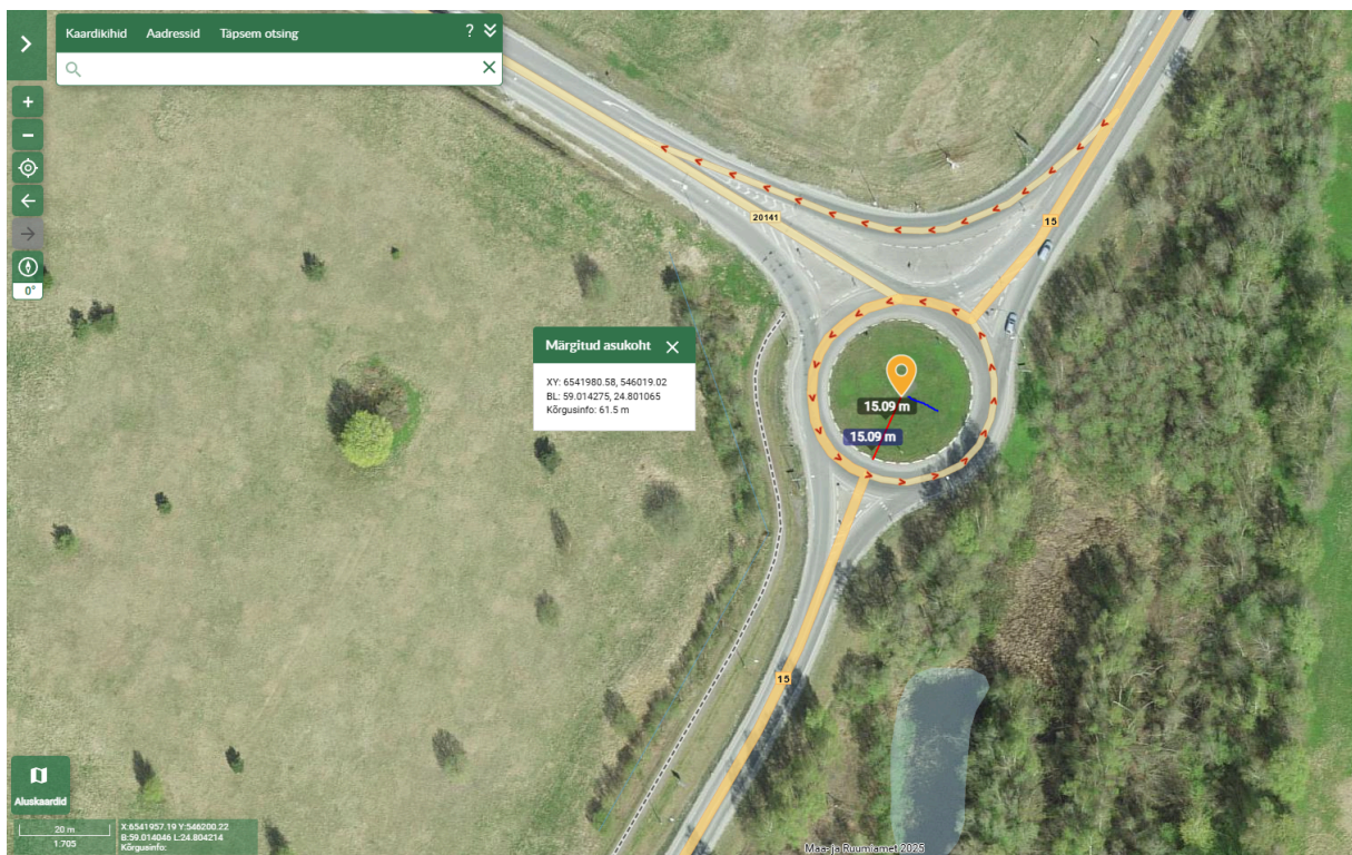
Lisa nr 1. Esimese reklaami asukoht.