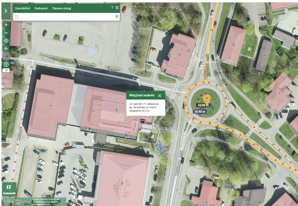
Lisa nr 2. Teise reklaami asukoht.