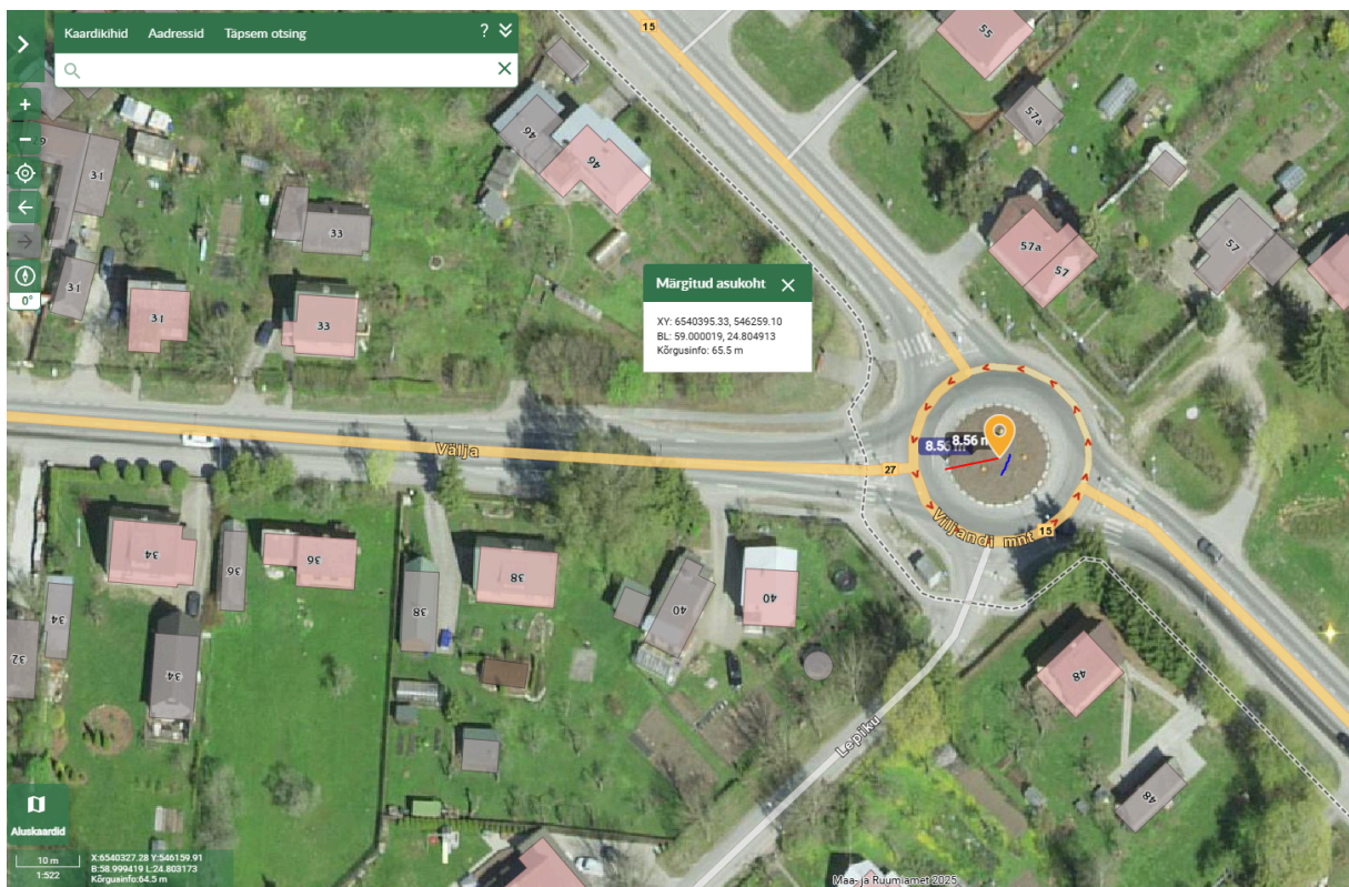
Lisa nr 3. Kolmanda reklaami asukoht.